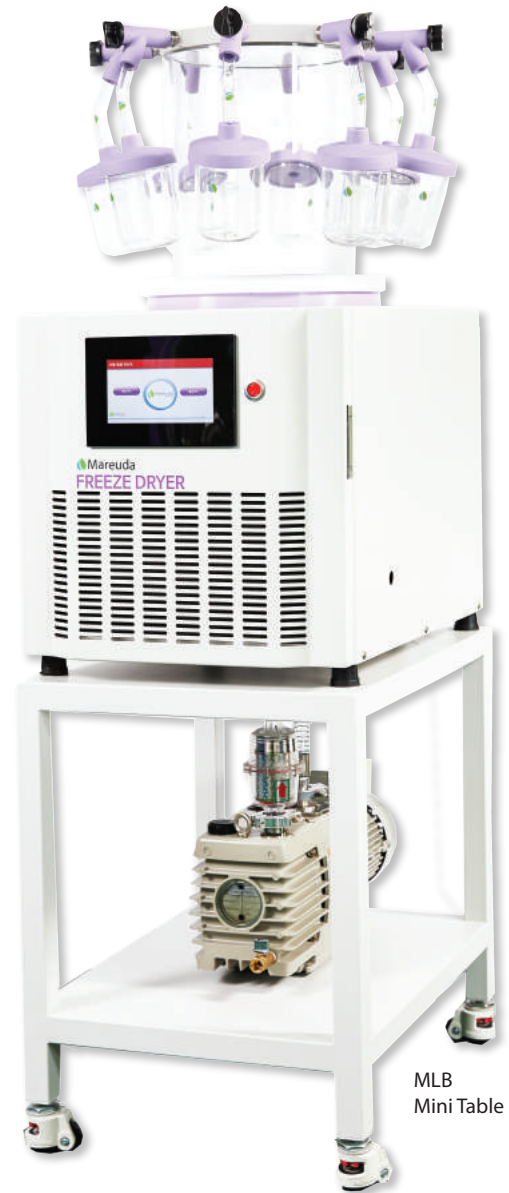
MLB Mini Table